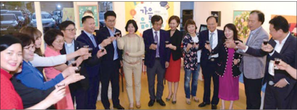
지난 2017년 진행한 무등CEO 아카데미 가을음악회.