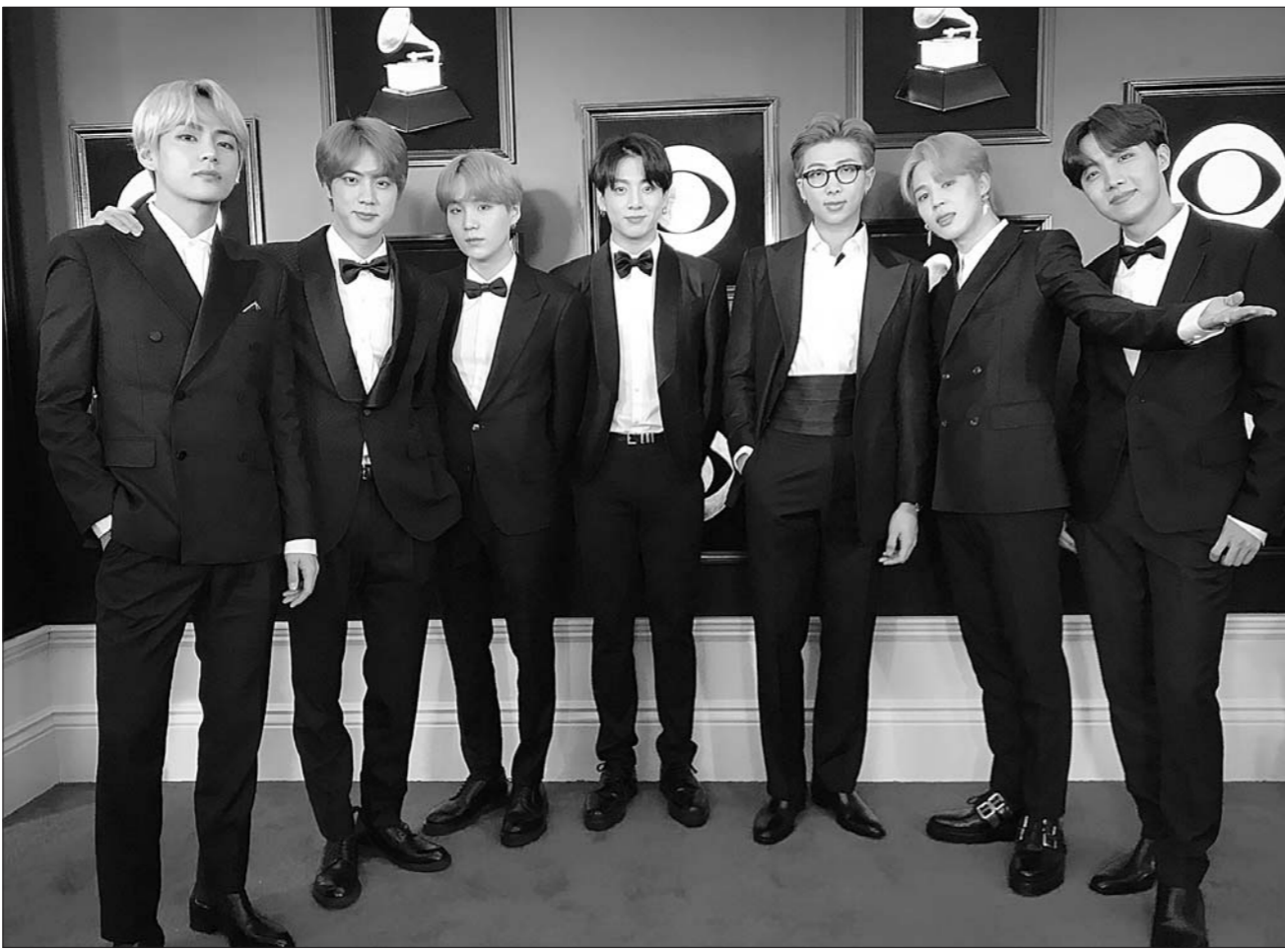
방탄소년단 제 61회 그래미 어워즈 레드카펫.

한편 방탄소년단은 2월 16, 17일 일본 후쿠오카 야후오쿠!돔에서 '러브 유어셀프' 일본 돔 투어를 이어간다.