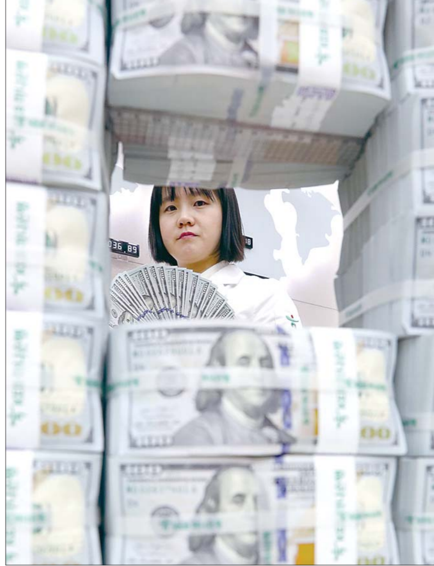
외환보유액 사상 최대 1월 말 외환보유액이 4천55억1천만달러로 사상 최대를 기록한 가운데 8일 오후 서울 중구 KEB하나은행 위변조대응센터에서 직원이 달러를 정리하고 있다. 뉴스

거운 반응을 얻고 있다. 개인고객상품은 이용금액의 0.5%, 기업고객상품은 이용금액의 0.1%가 기부되며, 광주은행은 지난해 12월 광주·전남 사회복지공동모금회에 약 1억3천만원의 기부금을 전달한바 있다. 기업고객상품인 광주·전남 사랑 기업사랑 Honors Card와 광주·전남 사랑 기업사랑 Card에 대한 관심도 뜨겁다. 비즈니스 지원 서비스, 여행 보험 서비스 등 법인 및 개인사업자의 비즈니스 활동에 최적화된 혜택을 탑재한 이 카드 역시 출시 3개월 만에 누적 판매 3천좌를 기록하며 흥행중이다. 박석호기자 haitai2000@srb.co.kr