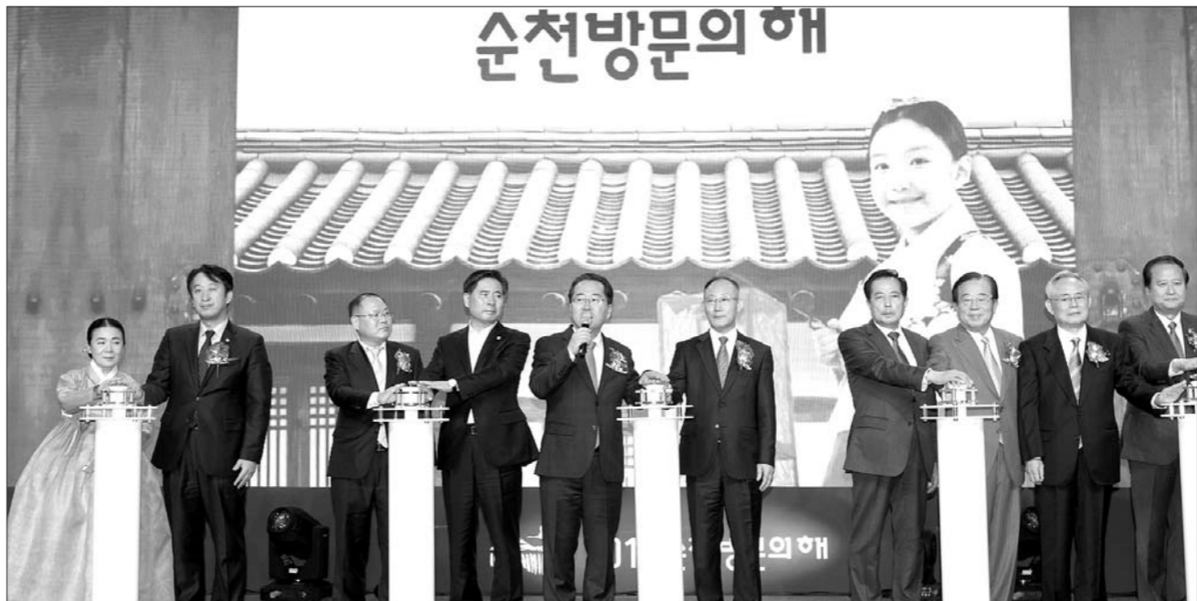
순천시는 지난 16일 서울 더 플라자 호텔에서 '2019 순천 방문의 해' 선포식을 개최했다.

이를 위해 수도권과 경강권을 대상으로 찾아가는 관광설명회를 개최하고, 순천여